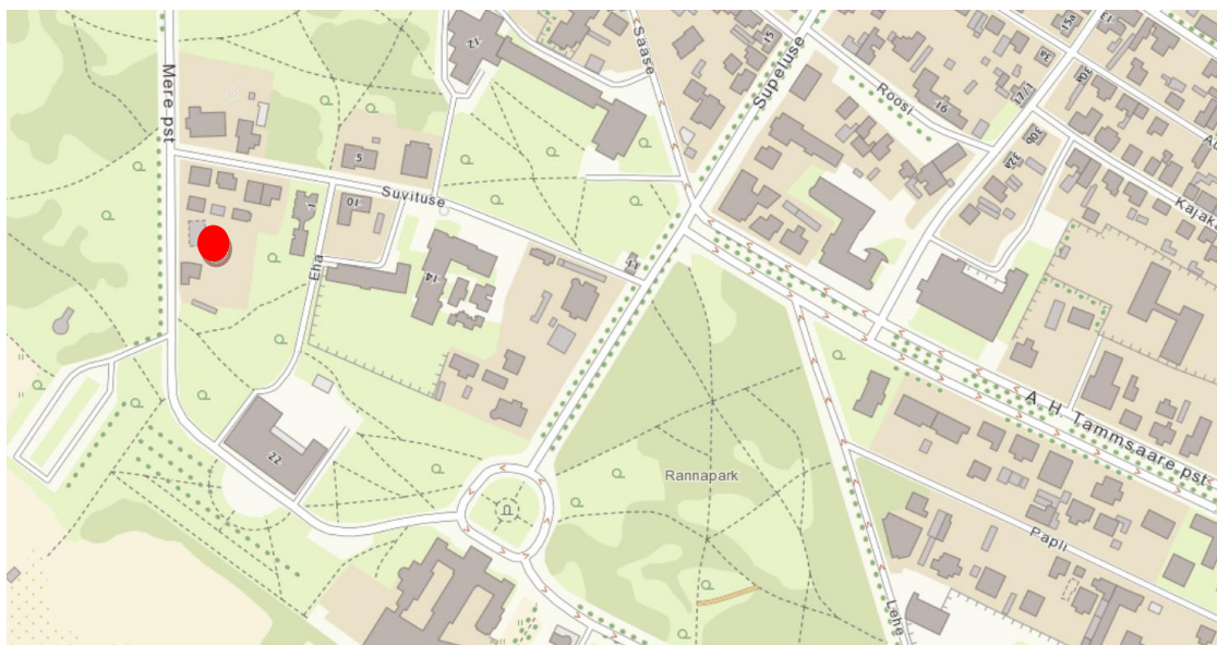
Joonis 1: Planeeringuala asendiskeem (aluskaardina on kasutatud Pärnu linna kaarti).

Planeeritav ala aadressiga Mere pst 18 (62510:012:2300) ning Suvituse tn 8 (62510:012:3260) asuvad Pärnus Eeslinna asumis. Planeeritav ala on ümbritsetud Mere pst 16 (62510:012:4110), Suvituse tn 2a (62510:012:4150), Suvituse tn 4a (62510:012:3990), Suvituse tn 6a (62510:012:3250), Suvituse tänav T1 (62510:016:0008), Eha tn 1 (62510:012:1640), Eha tn 3 (62510:012:3240), Mere pst 20 (62510:012:2990) ning Mere puiestee T2 (62510:013:0003) katastriüksustega.